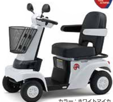
カラー：ホワイトマイカ

遊歩フジ ●TAISコード 00020-000048 希望小売価格 388,000円(非課税)