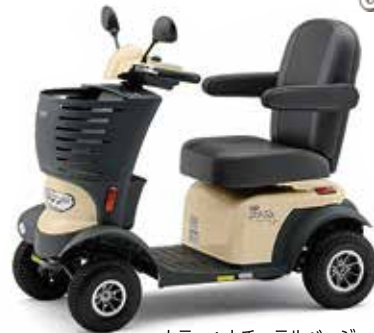
カラー：ナチュラルベージュ

遊歩スマイルアルファ ●TAISコード 00020-000053 希望小売価格 398,000円(非課税)